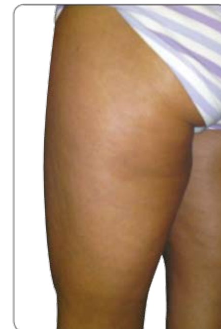
ETTER 6 mnd. bruk av Marine Matrix

Disse bildene viser hvordan huden er før og etter seks måneders bruk av kosttilskuddet kollagenhydrolysat (marine Matrix).