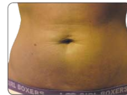
ETTER 6 mnd. bruk av Marine Matrix